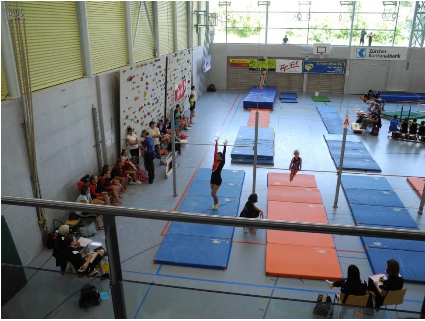
Mitten aus dem Wettkampf