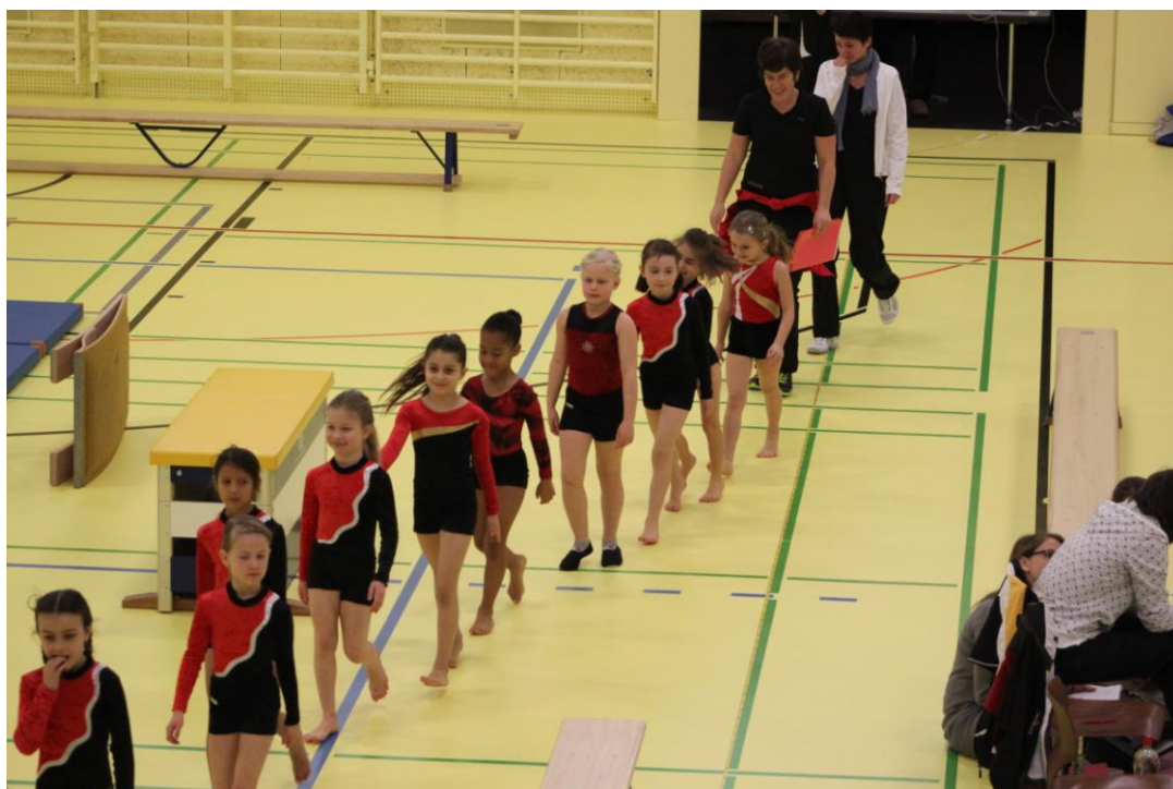
Erster Wettkampf geschafft: Ausmarsch