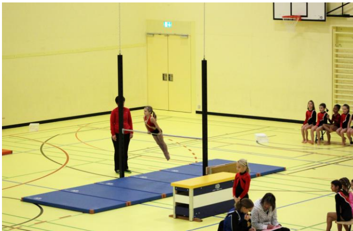
Mitten aus dem Wettkampf