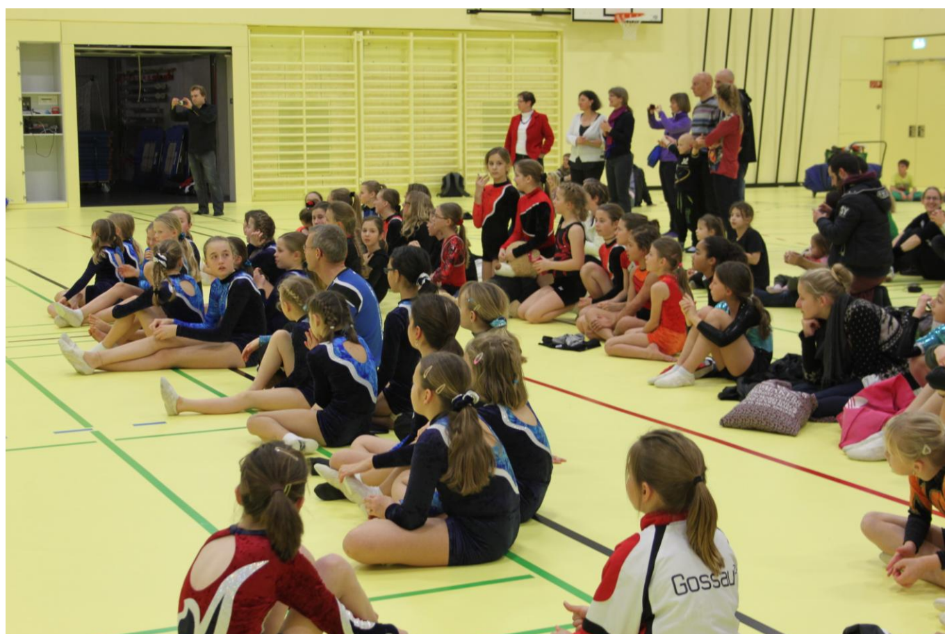
Gespanntes Warten auf die Rangverkündigung