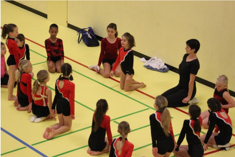
Unsere Jüngsten beim Einturnen