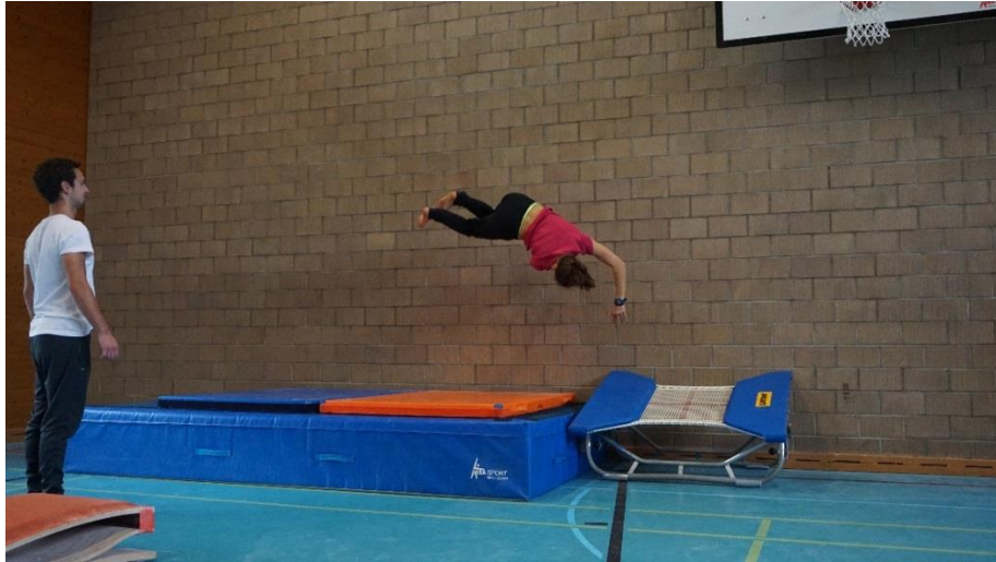
Am Schluss noch etwas Akrobatik in schwindelerregender Höhe.